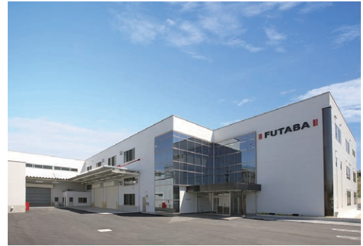
新築本社社屋及び電着工場